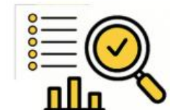
Audit de robustesse