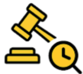
Le Service de Veille