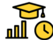
Mutualisation des études