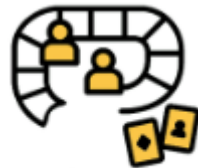
La fresque des scores