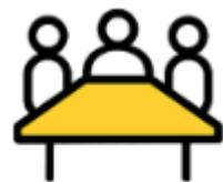
Les Groupes de Travail

Monitorer les évolutions dans les scores